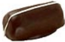
Passion Poire Cannelle