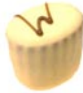
Black & White