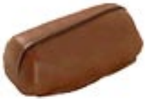
Passion Gingembre Orange