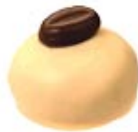
Manon Choco Café