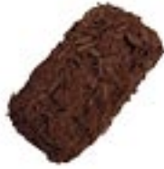
Truffe Paillette Café